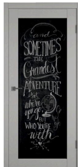
X32 | Грифельная доска