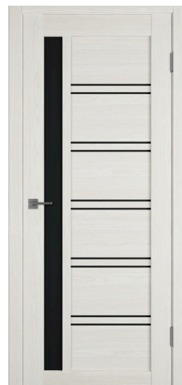
X38 | Черный лак