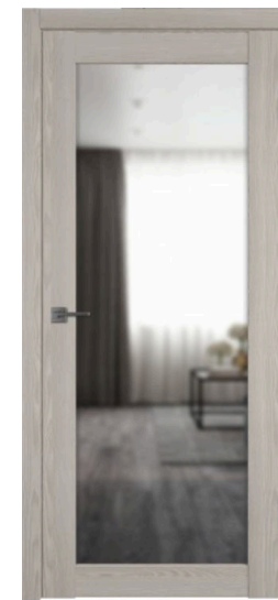
X32 | Зеркало