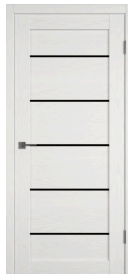
X27 | Черный лак