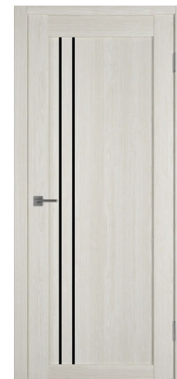
X33 | Черный лак